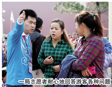
一局志愿者耐心地回答游客各种问题