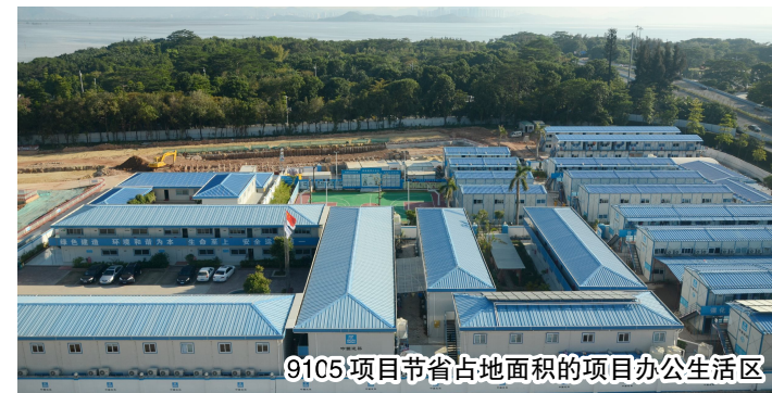
9105项目节省占地面积的项目办公生活区

中建一局成立于1953年，是中国建筑行业第一支“国家队”，是全球最大国际承包商、世界500强第52名——中国建筑的核心子企业，是以从事完全竞争性建筑业为核心业务发展壮大起来的国有重要骨干企业。中建一局业务板块覆盖房屋建筑、基础设施、投资开发、海外工程等领域，旗下拥有25家子企业，在全国主要城市和地区均设有分支机构，市场范围遍及全国，并延伸至俄罗斯及远东地区、中东欧、拉美、非洲、东南亚等世界主要地区和国家。