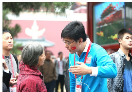
中建员工正在给游客做志愿服务

人民网北京10月8日电(贾兴鹏)国庆期间,来自中国建筑的30名志愿者走进天安门城楼,为中外游客提供引导、咨询服务,并开展文明旅游宣传、服务,这也是天安门管委会首次在“十一”天安门城楼游览中引入志愿者服务。