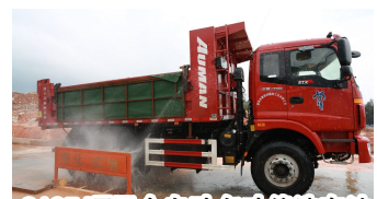
9105项目全自动多功能洗车池

▼中建一局深圳地铁9号线9105标段以“花园式防尘降噪示范工地”、“广东省安全文明示范工地”闻名深圳，赢得当地政府和各界的高度赞誉。