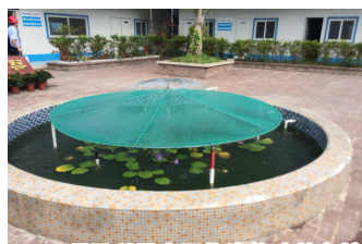
9105项目利用废旧物资修建的鱼塘