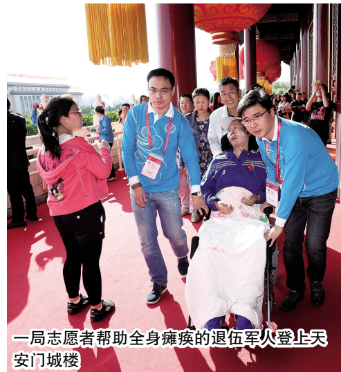
一局志愿者帮助全身瘫痪的退伍军人登上天安门城楼