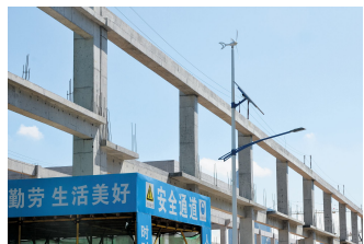
9105项目风光互补路灯系统