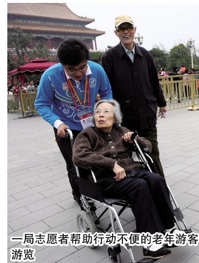
一局志愿者帮助行动不便的老年游客游览

务外国游客近百次,帮助残疾人登城楼参观十余次,受到了天安门管委会和中外游客的一致好评。服务期间,中建一局集团公司党委书记、董事长罗世威,党委副书记、副总经理单广袖分别来到天安门慰问志愿者。罗世威表示,志愿者彰显了中建一局的先锋文化,是企业社会责任感的集中体现。本次志愿服务活动被人民网、《联合早报》、凤凰网等多家知名媒体纷纷报道,引起了热烈反响。