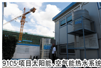
9105项目太阳能、空气能热水系统