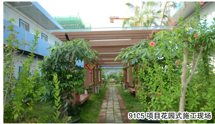
9105项目花园式施工现场