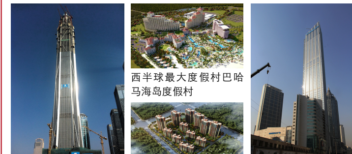
西半球最大度假村巴哈马海岛度假村

中建一局始终瞄准行业技术前沿，力争在建筑智能化、信息化上迈出实质性步伐，将BIM技术应用到建筑施工全过程，为人们带来更佳的幸福体验。