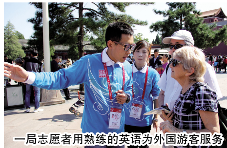
一局志愿者用熟练的英语为外国游客服务