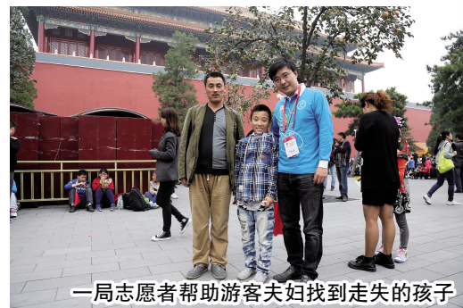
一局志愿者帮助游客夫妇找到走失的孩子